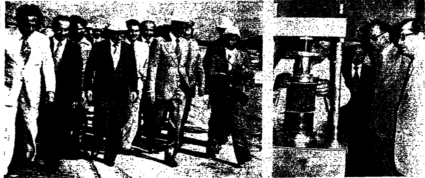
قام رئيس الحكومة الدكتور سليم الحص بترافقه وزير الأشغال المهندس أمين البري بزيارة إلى مطار بيروت فقد خلالها سرح العمل في توسيع المطار، وأطلع على حاجات الصيانة المختلفة، والمصور اعلام للحص خلال الزيارة.